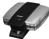
Brüsseler Waffelautomat 1445