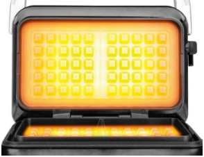
DOBBELTE VARMEELEMENTER FOROVEN OG FORNEDEN giver jævn varmfordeling