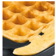
BESKYTTELSE MOD OVERLØB